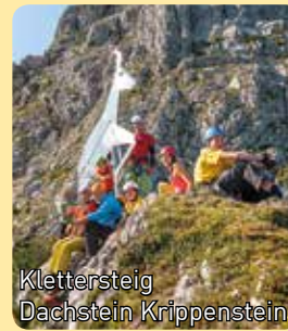
Klettersteig Dachstein Krippenstein